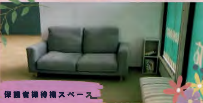
保護者様待機スペース