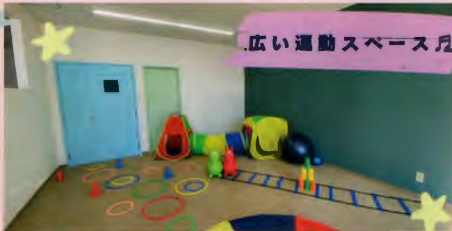
広い運動スペース

療育活動として行う運動のプログラムでは感覚統合の理解を用いて「お子様が思わず熱中してしまう活動＝遊び」を用いながら発達を促し個々の能力を引き出せるような活動を行います。